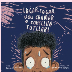
EDGAR, EDGAR, VOU CHAMAR O CONSELHO TUTELAR! Caroline Arcari e Érika Astronauta

Um livro de atividades divertidas e didáticas com os personagens Pipo e Fifi. É um complemento ao livro premiado Pipo e Fifi: ensinando proteção contra violência sexual . Conta com atividades para imprimir quantas vezes quiser: bonequinhos de papel, atividades de corte e colagem, jogos, cartinhas etc.