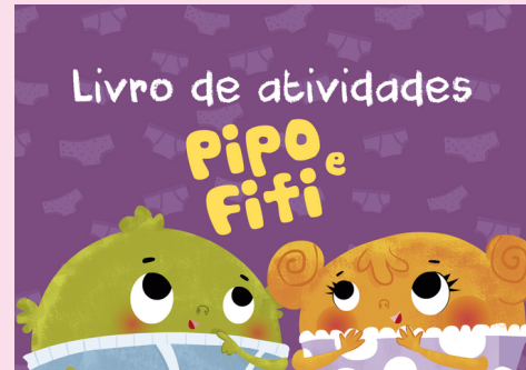
LIVRO DE ATIVIDADES PIPO E FIFI Caroline Arcari e Isabela Santos

Pipo e Fifi, nosso multipremiado livro infantil, é uma ferramenta de proteção que explica às crianças conceitos básicos sobre o corpo, sentimentos, convivência e trocas afetivas. De forma simples e descomplicada, ensina a diferenciar toques de amor de toques abusivos, apontando caminhos para o diálogo e a proteção.